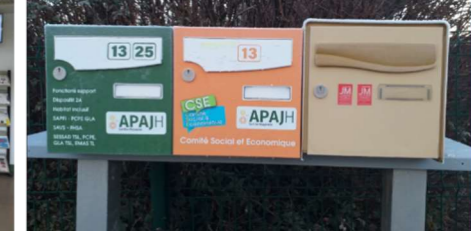
Création d'un bureau en cours